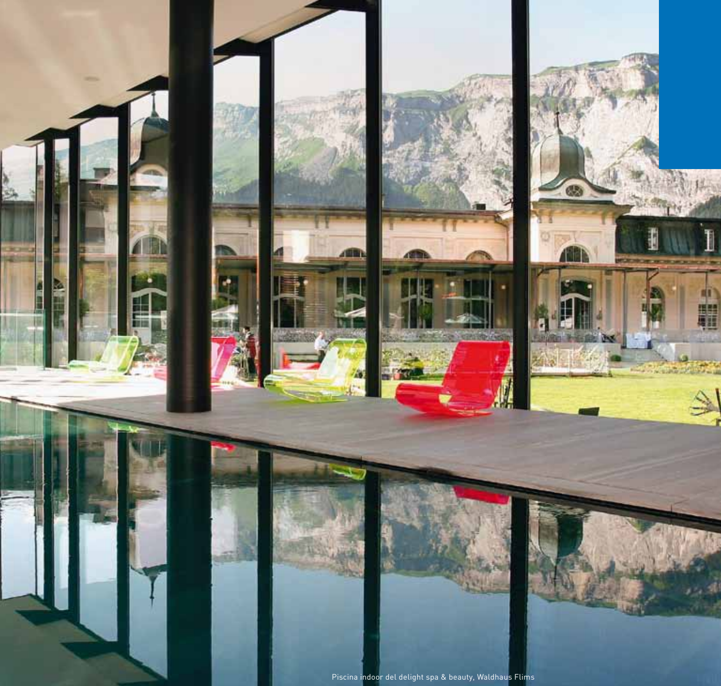
Piscina indoor del delight spa & beauty, Waldhaus Flims